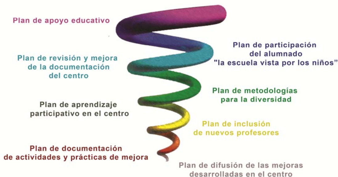
Figura 3. Evolución en espiral de planes de mejora en un centro