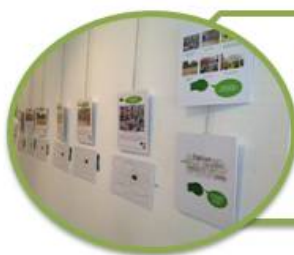
Figura 5. Proceso Fotovoz: la escuela vista por los niños (continuación).