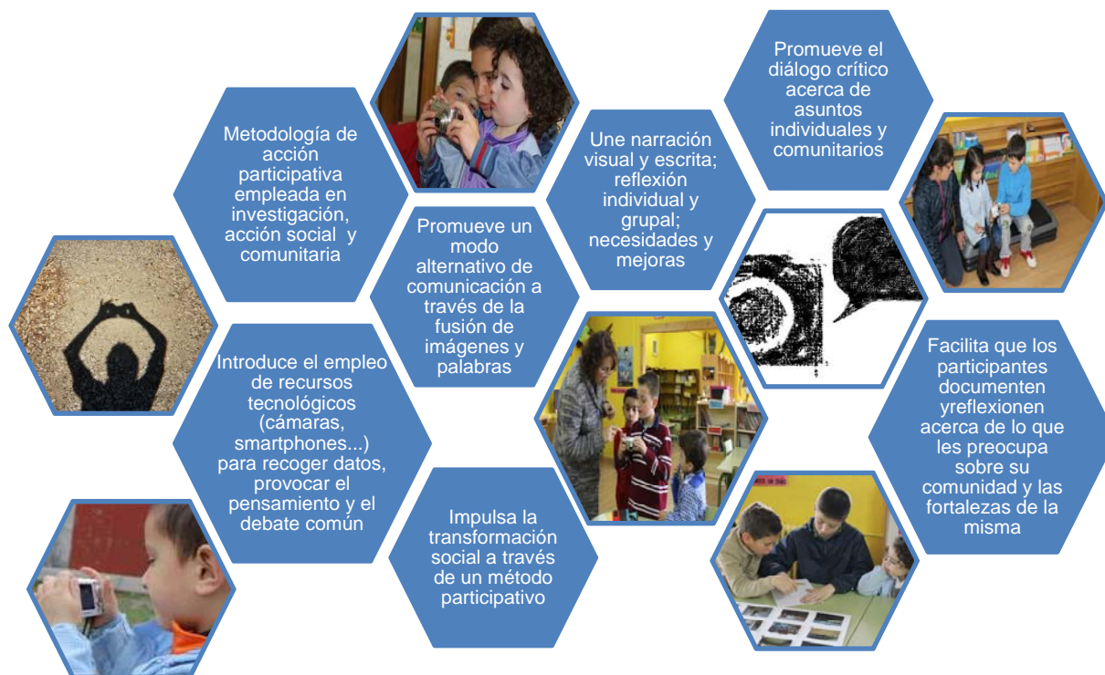
Figura 1. Panel de características del proceso Fotovoz

Brydon-Miller, Laine y Johnson, 2012; Latz, 2012; Leipert y Anderson, 2012; Messiou, 2012).