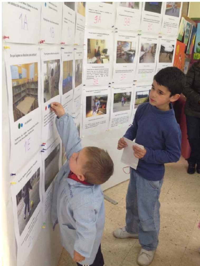
Figura 8. Proceso de votación de fotografías y narrativas para el mural

II) Lugares y situaciones en las que los estudiantes coinciden en que les gusta participar .